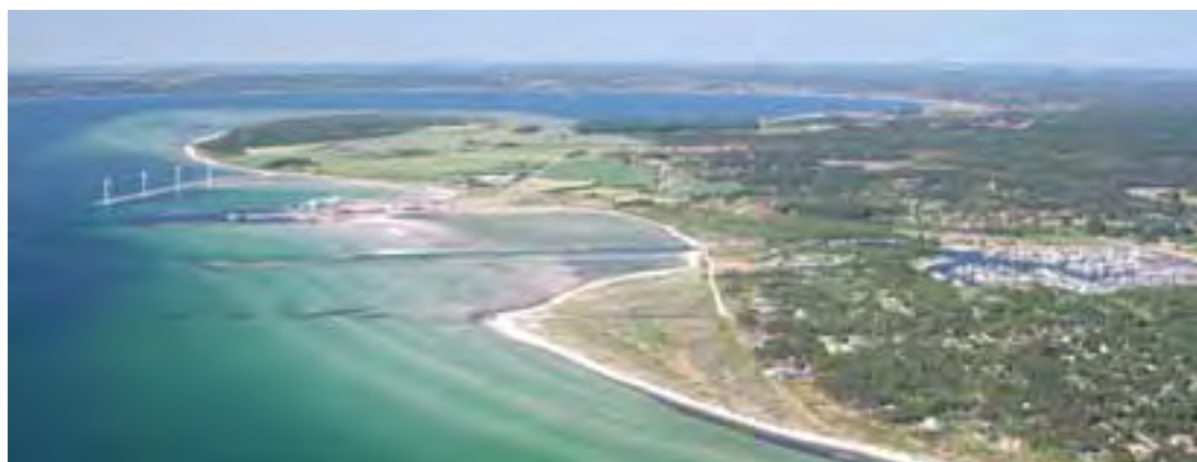
Gåsehage og Ebeltoft Færgehavn - nye strande skabt af sandvandring langs kysten.